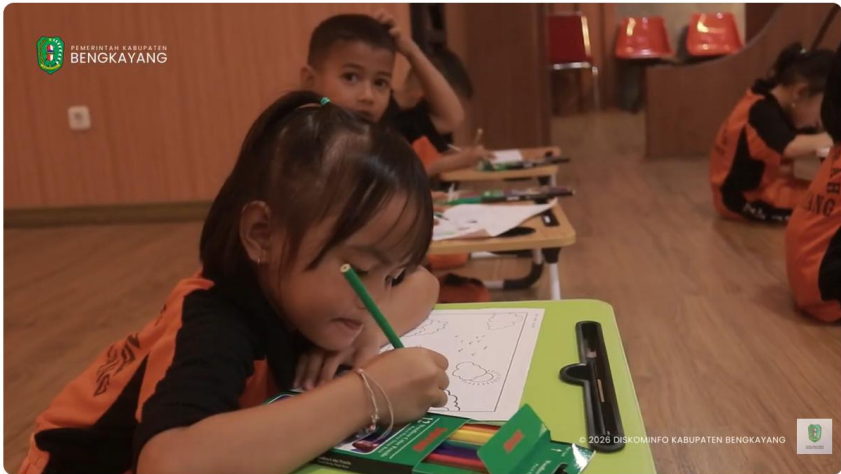
ANAK HEBAT INDONESIA KUAT DISKOMINFO BENGKAYANG OFFICIAL 1,52 rb subscriber