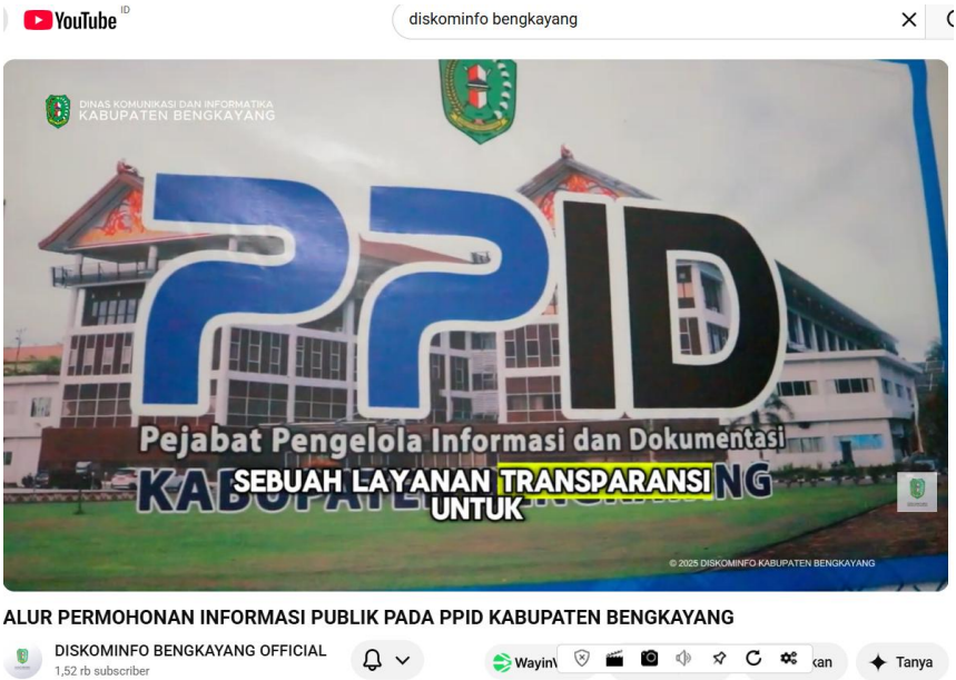
ALUR PERMOHONAN INFORMASI PUBLIK PADA PPID KABUPATEN BENGKAYANG DISKOMINFO BENGKAYANG OFFICIAL 1,52 rb subscriber